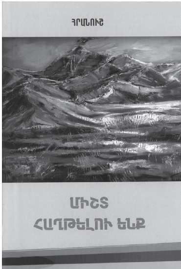
Գեղարվեստական պատկերները Հրանուշի «Ընդմիջտ հաղթելու ենք» գրքում

Հեռանում, բայց չէր ծուլվում մթին... Թվաց, թե խավարի մեջ մի լույս է քայլում: Թվա՞ց... Հրանուշ