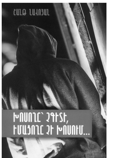
ԽՈՍՈՂԸ ԶԳԻՏԻ, ԻՄԱՅՈՂԸ ԶԻ ԽՈՍՈՒՄ...