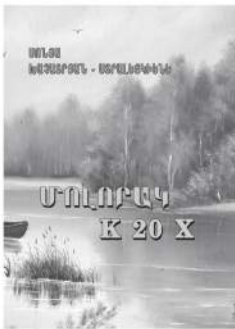
«Արծալ» հրատարակչությունը լույս է ընծայել Սոնյա Խաչատրյան-Ստրալցեկիների «Ամուրյակ K 20-X» արձակ ստեղծագործությունների ժողովածուն: Ընթերցողին ենք ներկայացնում «Ամուրյակ» գեղարվեստական դրվագը: