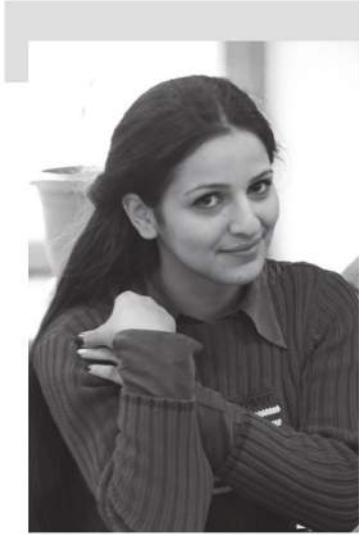
Երակներով գրչիս երազներ են հոսում... Ես գրում եմ սարած ու չապրած զգացմունքներիս մասին: Գրում եմ անս երազում, ոչ թե քանաքե զրջով, այլ տեսլական սուր ու բեկուն միջերով: Գրում եմ երազներս, որոնք չեն ուզում կատարվեն, չէ՛ որ սիրում եմ նրանց հենց այդպես: Ես մյուսների պես երբևէ չեմ ասում, թե չեմ կարող սարծ րաանց գրելու թեկուզ մեկ օր...